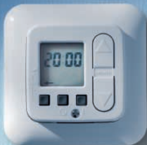
Die U25 ist auch als Aufputz-Version erhältlich